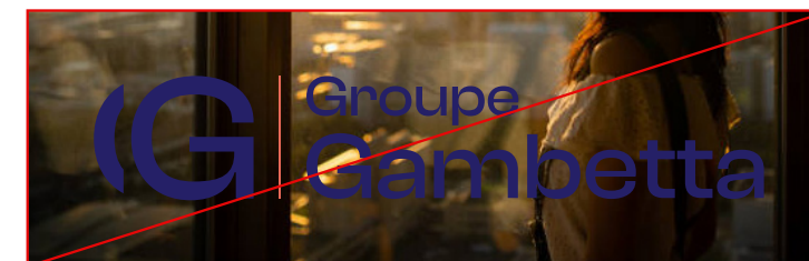
APPLIQUER LE LOGO DE COULEUR SUR UN FOND FONCÉ