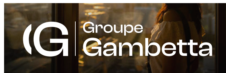
VERSION BLANC SUR ICONOGRAPHIE FONCÉE