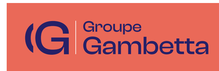
VERSION COULEUR SUR FOND CORAIL