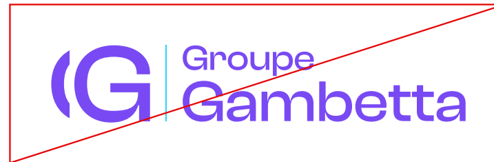
UTILISER DES COULEURS HORS CHARTE