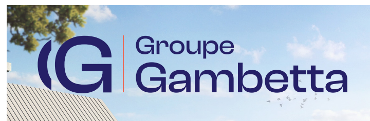
VERSION COULEUR SUR ICONOGRAPHIE CLAIRE