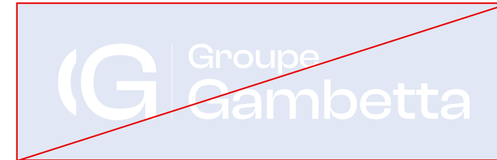
APPLIQUER LE LOGO EN BLANC SUR FOND CLAIR