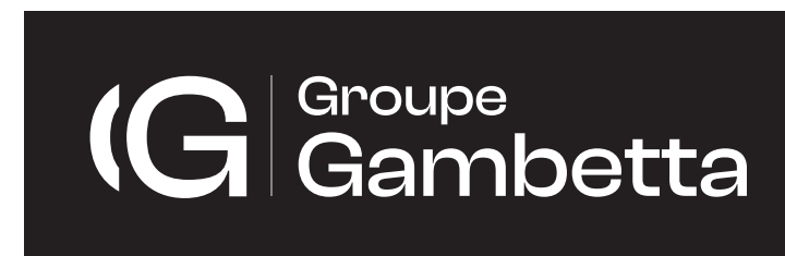
EN NOIR ET BLANC